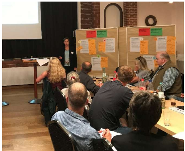
Impressionen aus der Abendvisite in Dellstedt